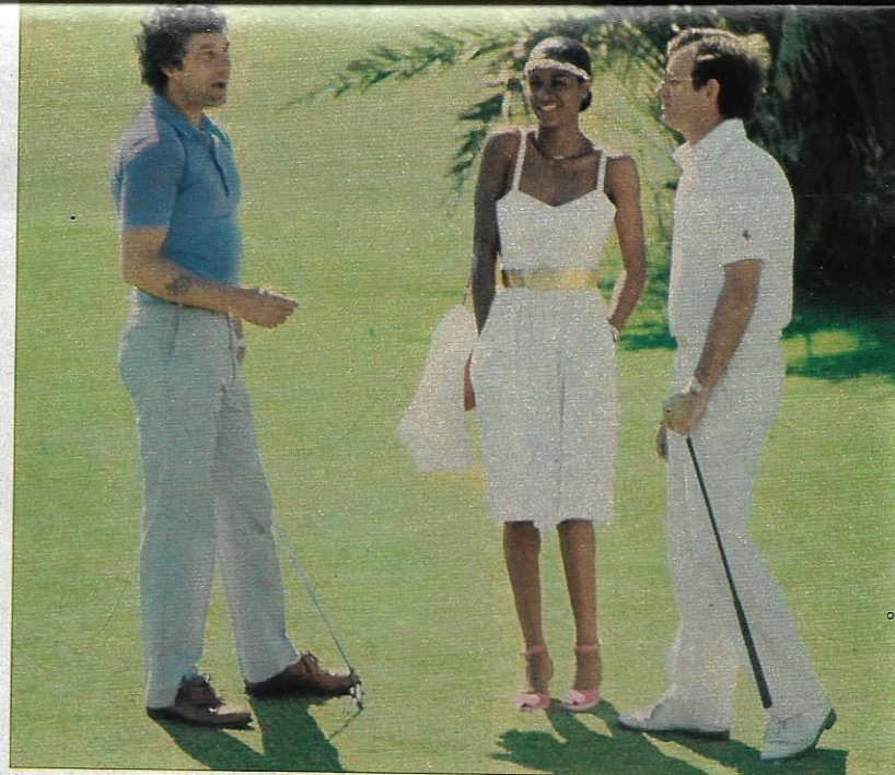
La famosa cantante de color Grace Kennedy, junto a su marido y el actor Gareth Hunt, ambos participantes en el torneo