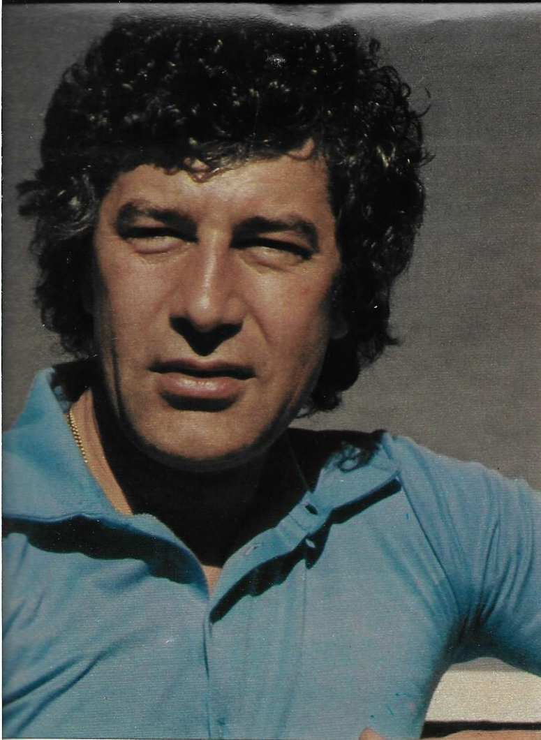
Gareth Hunt, famoso por la serie "Los nuevos vengadores", se encuentra en Marbella jugando al golf, y aunque ha asistido solo, afirma que está muy enamorado de su esposa y que es un gran amante de la vida hogareña

GARETH Hunt, más conocido por estos lares como Gambit, el atractivo y arriesgado consero de fatigas de la intrépida Purdie y del que de espaldas, podemos comprobar la escultural y el estilo de modelo de alta costura que con su primavera nos mostró la gran cantante Grace Kennedy en su luna de miel